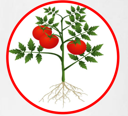
Maturation des fruits

Humic Solution MAP SOLUTION ROOT Solution Hydro Solution 13-40-13