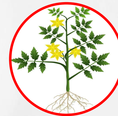
Développement des fruits